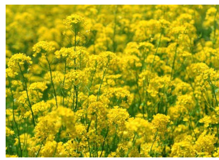
優秀企画賞（エコロジー） 『「草の油田」の可能性を探る！ バイオマス資源とエネルギー』29分 製作：アース・スピリット