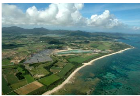
部門優秀賞【コボレト・コミュニケーション部門】 『みるくゆへの飛翔 新石垣空港建設－環境編－』20分 製作：シネマ沖繩